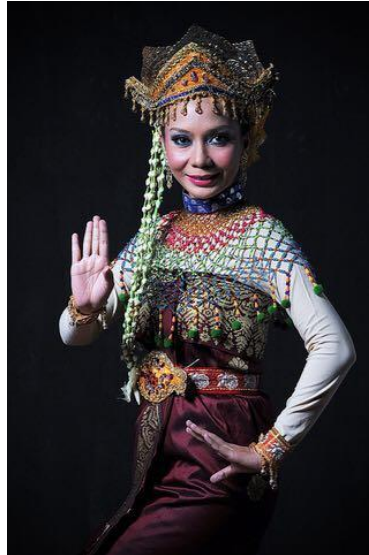
Rajah 3: Busana dan aksesori Mak Yong

kertas tebal yang dibalut dengan kain baldu serta dihias dengan batu permata. Sehelai kain sibar tergantung di bahu kiri Mak Yong dan diselit di bawah pending. Kain sibar biasanya bertekak benang emas dan panjangnya dari bahu hingga ke paras lutut.